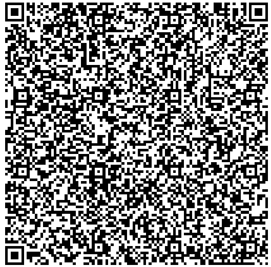
Certificat COVID Numérique EU