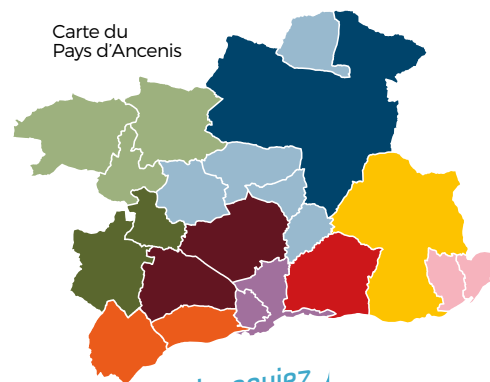
Carte du Pays d'Anenis