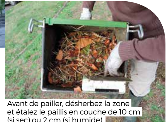
Avant de pailler, désherbez la zone et étalez le paillis en couche de 10 cm (si sec) ou 2 cm (si humide).

Comment ? Couvrez la terre avec des débris de végétaux. Cela diminuera le recours au désherbant et vous permettra d'améliorer la santé des plantes et de fertiliser votre jardin.