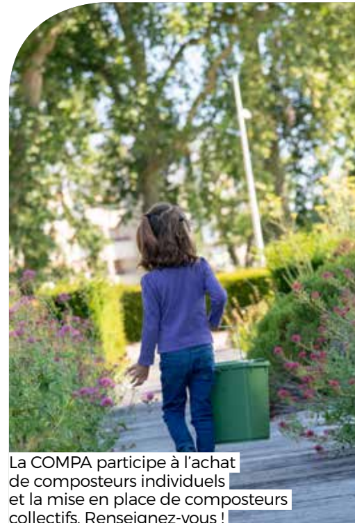
La COMPA participe à l'achat de composteurs individuels et la mise en place de composteurs collectifs. Renseignez-vous !